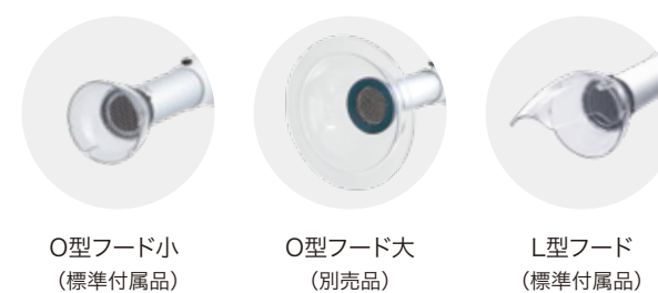
O型フード小 (標準付属品)

O型フード大・小とL型フードの3種類のフードから先端の形状が選べ、診療や処置等の状況や患者さんの体位に合わせて、狙いを定めたアプローチが可能。開口部の広いフードが、体内から飛散する血液、唾液、体液等の飛沫を吸引します。