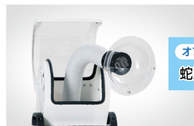
オプション品 蛇腹アーム