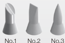
No.1 No.2 No.3